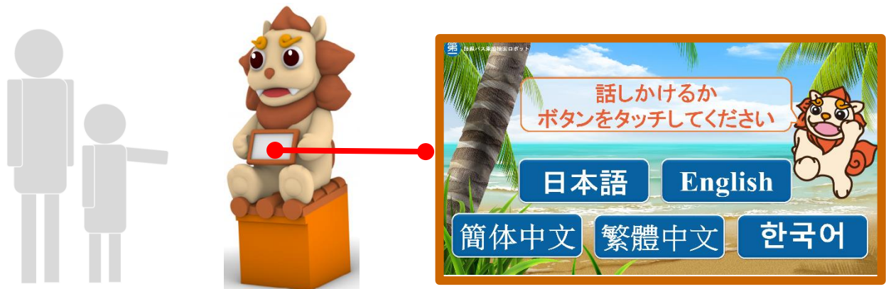
【那覇バスターミナル内の「路線バス乗り換え検索ロボット」（イメージ）】

那覇バスターミナルは、多くの観光客が訪れる県都・那覇市の重要な交通拠点であり、2018年10月に1F待合室に設置した「バスナビ案内所」の高機能化を図り、路線バスの利用拡大へとつなげて参ります。