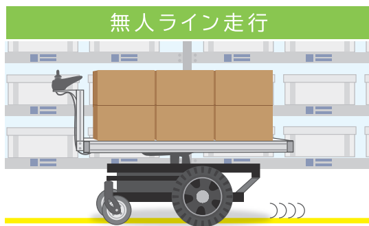
簡単に敷設できる反射テープを認識